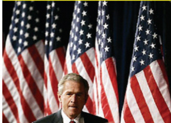
El presidente dijo que las elecciones parlamentarias del jueves en Irak serán históricas y que sembrarán la democracia en el Medio Oriente.